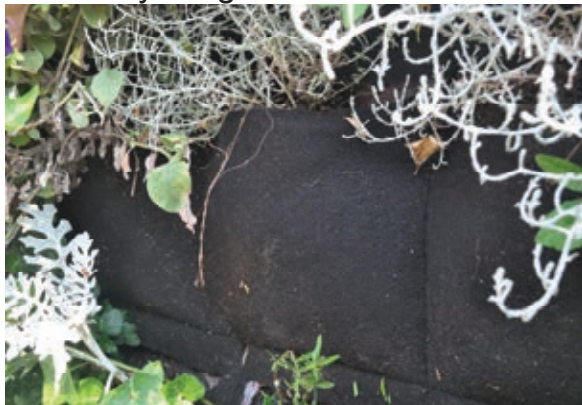
Fig. 6. Flexible bags

Another form of combining a lightweight screen with the trays are flexible bags. It is an in-line arrangement of pockets filled with the substrate in which there are plants (Fig. 6). The main advantage is the possibility of being applied on untypical surfaces, e.g. the curved or inclined ones (Manso et Castro-Gomes, 2015) (Fig. 7). Although it is a system of pockets, just like the lightweight screen, the presence of the substrate and the undefined volume of space for the roots allow an unlimited selection of plants. On the other hand, the heavy weight must be considered its most serious disadvantage.