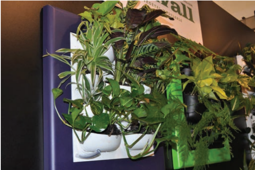
Fig. 5. Planter panels

As for the vessels, they are an integral part of the building, so they should have been planned at the stage of the building being designed by an architect. However, in some cases, an alteration to an already existing building is possible, too.