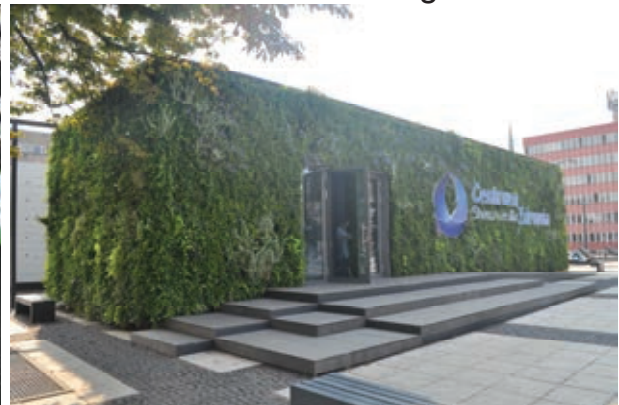
Fig. 7. A living wall made by flexible bags