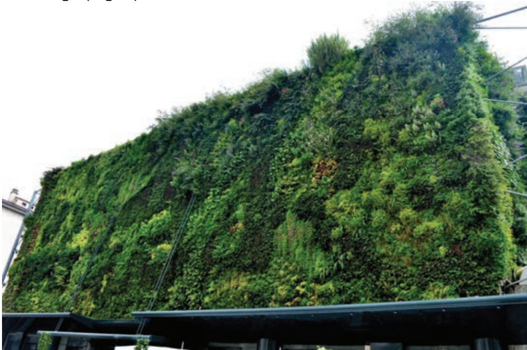
Fig. 2. Continuous living wall system

At the base of the installation there is a tank for unused water. In the tank, a pump is mounted for transporting the water upwards for reuse. The main advantage of these installations, besides the above mentioned immediate vegetation cover, is their relatively low weight and a flexible design which allows giving them any shape and even introducing plants in the corners of the buildings (Fig. 2).