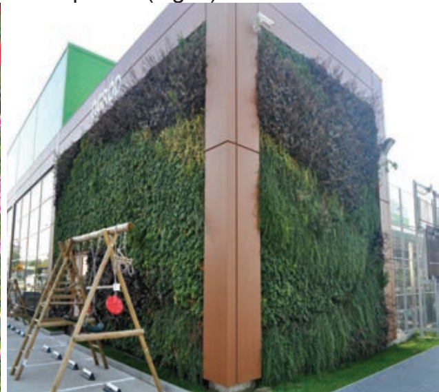
Fig. 3. Construction of panels (trays) Fig. 4. A living wall made by trays

Some form of a merger of the two previously described systems are the wall tiles known as planter tiles, characterised by the beauty of the tiles themselves (Fig. 5). Just like the lightweight screen, it is a system of pockets,